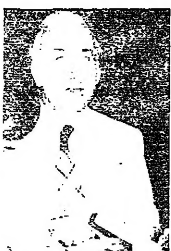
النائب اوغست باخوس

عويديت مع الادارة الموسعة ، وايوا فضل مع الادارة العصفية ، ولكل منها منطلقة ، وفي مقترحات تطوير الحياة النيابية ، لكن الاثنان على رغم اختلاف معقم الممارسات الحكومية السابقة ، فيسئل كلس اسبيل الحفنة وميسلتها . فرنسية لليس